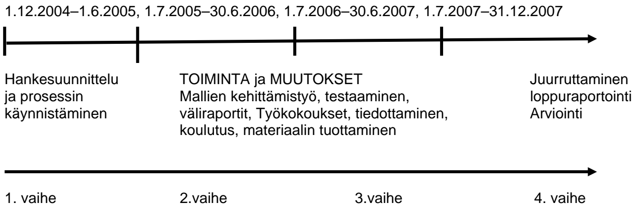
Kuvio 1: Hankkeen toiminta-aika 1.12.2004 - 31.12.2007

Hankkeen aikataulu asetettiin kuviossa 1 kuvatulla tavalla. Hanke alkoi joulukuussa 2004 ja asetettiin päättyväksi vuonna 2007. Projektikoordinaattori vaihtui 1.8.2006. Hanke kuitenkin jatkui asetettujen tavoitteiden mukaisesti.